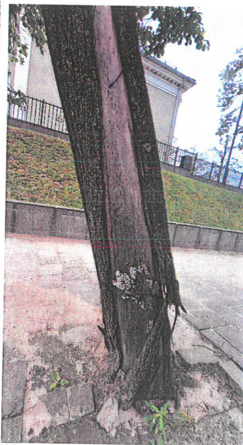
Nr. 19 ilga bežievė žaizda