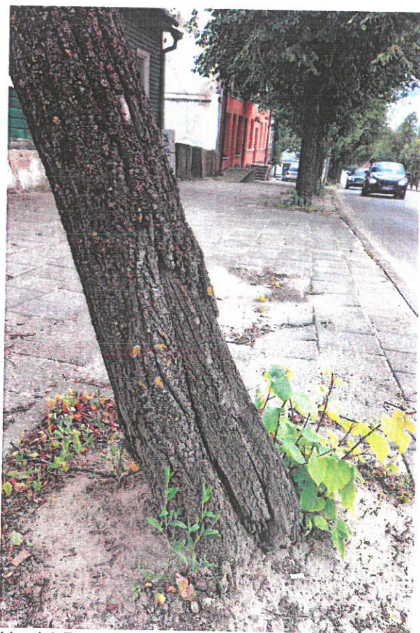
Nr. 14 Pavojingas dėl puvinų pamate