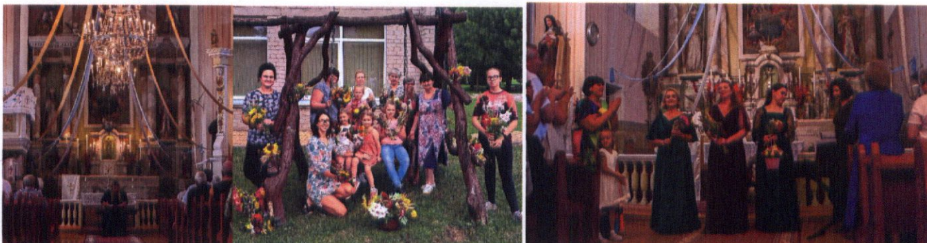
Žolinės renginiai Pabaiske '2023

Visokeriopai palaikome seniūnijoje aktyviai veikiančių nevyriausybinių organizacijų iniciatyvas ir projektinę jų veiklą. Dažnu atveju esame projektų įgyvendinimo partneriais. Tradicinė Žolinės šventės metu prisidėjome įgyvendinant Pabaisko krašto bendraminčių klubo organizuotų trijų dienų renginių ciklo.