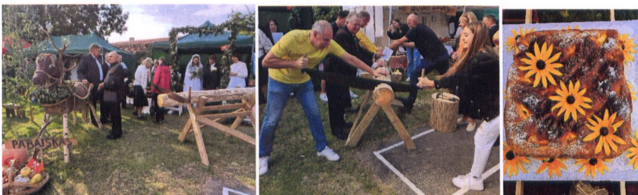
Seniūnijos kiemelis Žemaitkiemyje

Tradiciškai seniūnija subūrė savo krašto žemdirbius, bendruomenininkus, saviveiklininkus ir dalyvavo rajoninėje derliaus šventėje – Aniuolų sargų kermošiuje.