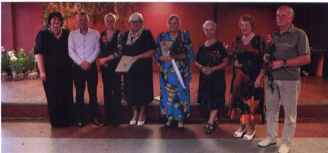
Pagerbti Pabaisko seniūnijos bendruomenių lyderiai 2023 09 08

Nevyriausybinių organizacijų ir bendruomeninės veiklos stiprinimo 2023 metų veiksmų plano 1.1.6 priemonės „Stiprinti bendruomeninę veiklą savivaldybėse“ įgyvendinimo Ukmergės rajono savivaldybėje skirtas lėšas įsisavino Varinės kaimo bendruomenė pateikusi ir gavusi finansavimą projektui "Bendrystė savojo krašto ritmu“. Baigiamojo renginio metu Seniūnija pagerbė ir apdovanojo veiklos dvidešimtmečius šventusias Pabaisko ir Antakalnio kaimo bendruomenes. Simboliškos padėkos įteiktos bendruomeninių organizacijų esamiems ir buvusiems pirmininkams.