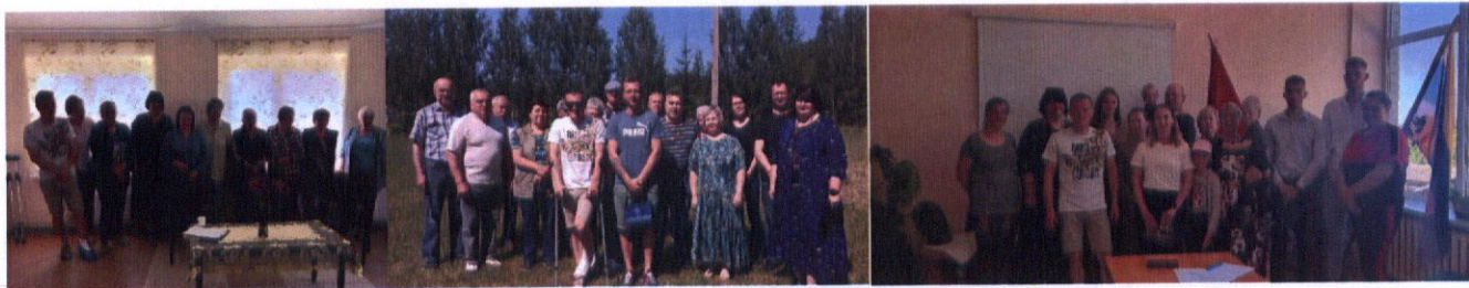
Antakalnio, Varinės, Pabaisko seniūnaitijų seniūnaičių rinkimai 2023 05 28